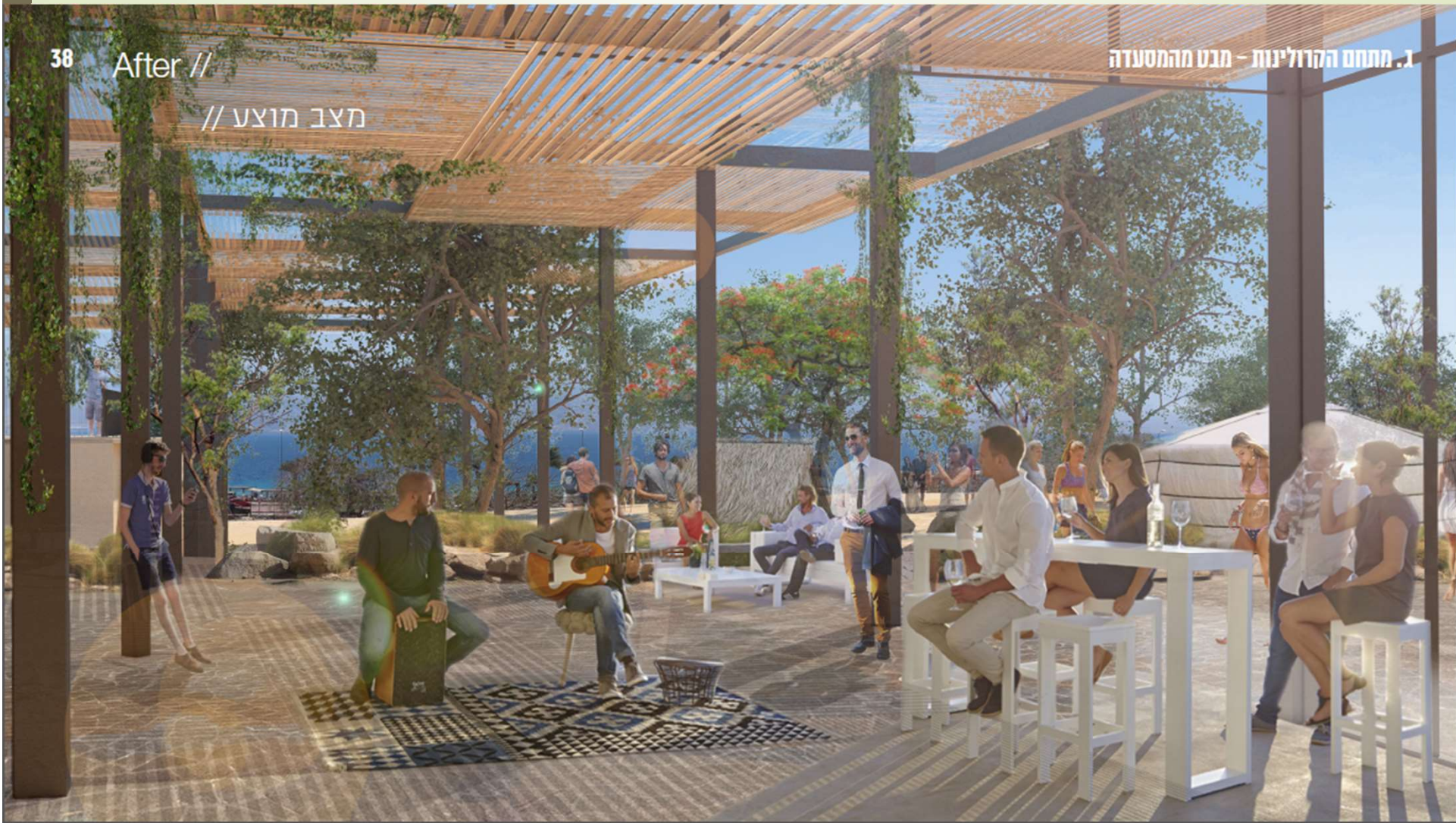
38 After // מצב מוצע //