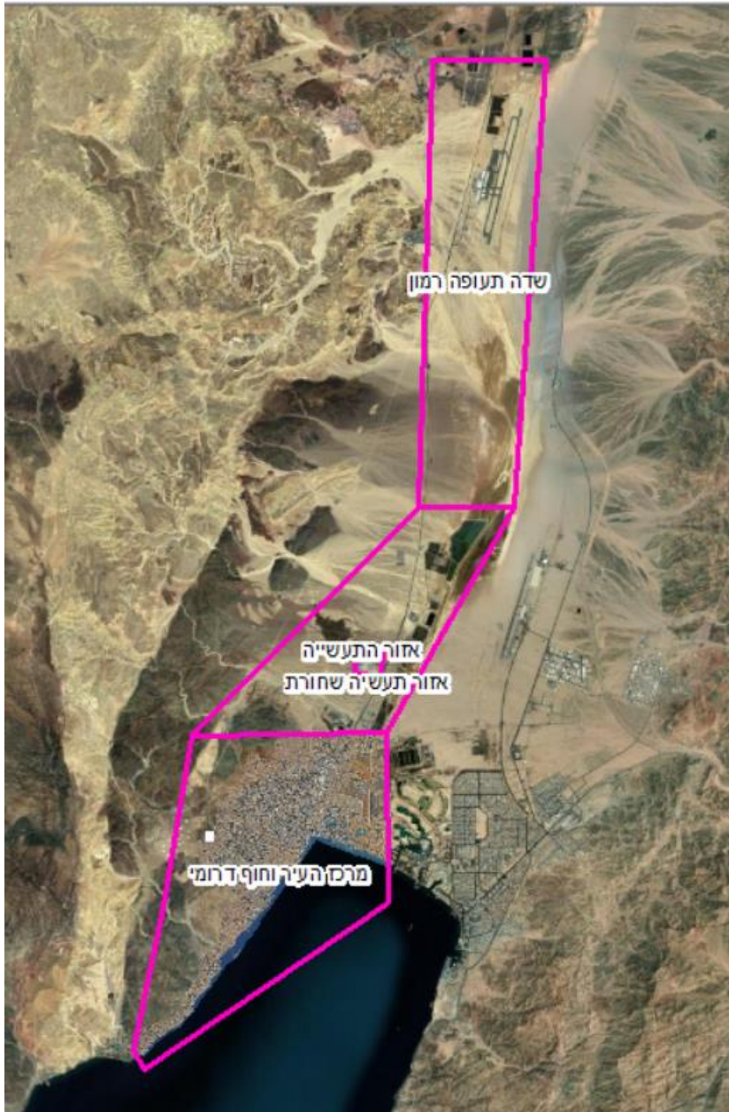
מפה 4 - כלל אזורי הפרוייקט