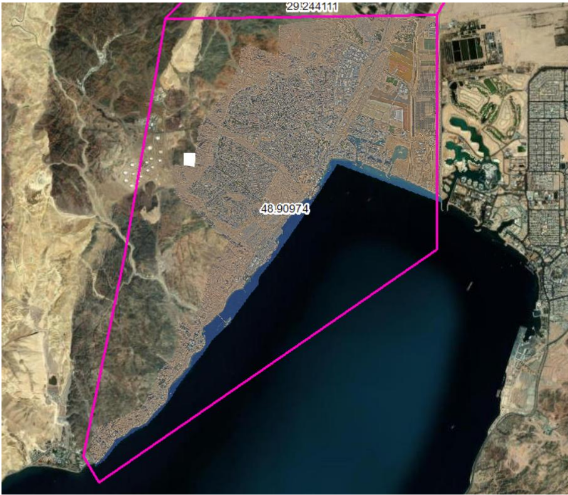
איור 3 - תיחום אזור דרומי (מרכז העיר ורצועת החוף הדרומית)