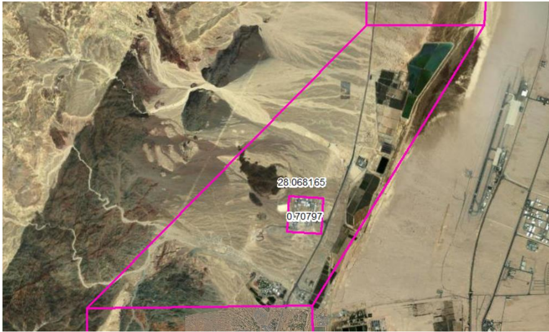
00.02 איור 2 - תיחום אזור התעשייה שחורת